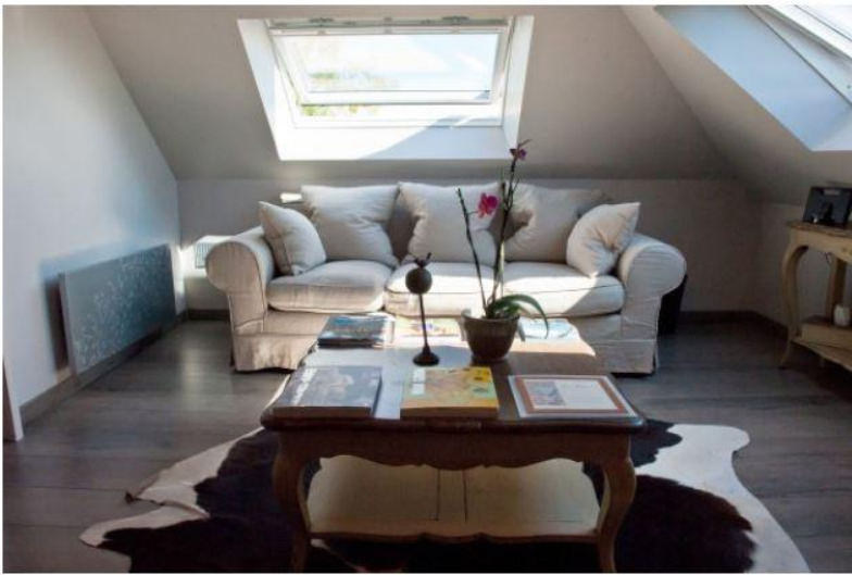
Une seconde chambre :